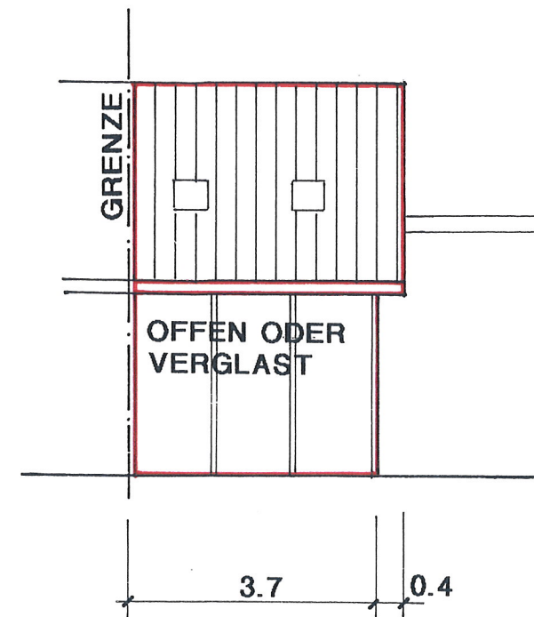
MST. 1 : 100