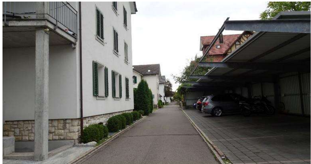
Abbildung 6 Eisenbahnstrasse: Parkierung Mehrfamilienhaus Kat. Nr. 5849 und 6543 (PLANAR, Oktober 2020)

Die Parzelle Kat. Nr. 6543 ist heute mit oberirdischen Abstellplätzen des Mehrfamilienhauses auf der Parzelle Kat. Nr. 5849 überbaut. Sie ist aufgrund der geltenden Strassen- und Grundabstände nicht überbaubar. Mit der Festlegung eines reduzierten Strassenabstandes von 5 m wird die Nutzung der Parzelle ermöglicht. Im nördlichen Bereich des Grundstücks wird der heute unüberbaute Wendepplatz mit einer Baulinie gesichert. Gegen Westen könnte zur Verbesserung der Überbaubarkeit ein reduzierter Grenzabstand gegen die Gleisparzelle geprüft werden, da der tatsächliche Abstand zu den Gleisen, im Vergleich zu den südlich anschliessenden Liegenschaften, aufgrund der Parzellarstruktur grösser ausfällt.