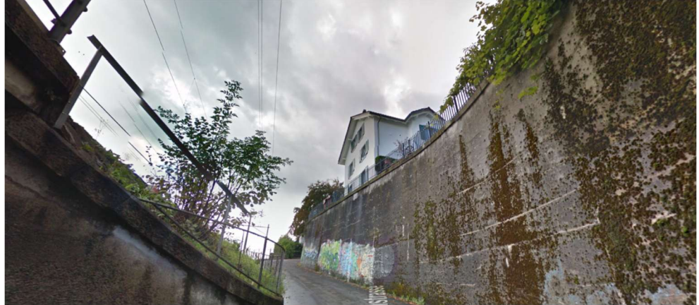
Abbildung 7 Zehntenstrasse: Stützmauer gegen die Grundstücke Kat. Nr. 2993 und 2994

haushälterischen Bodennutzung ein reduzierter Strassenabstand festgelegt, welcher sich weitgehend am Bestand orientiert bzw. etwas mehr Spielraum gibt. Auf diesem Abschnitt der Zehntenstrasse wird die Verkehrsbaulinie dementsprechend in einem Abstand von 2.5 m festgelegt.