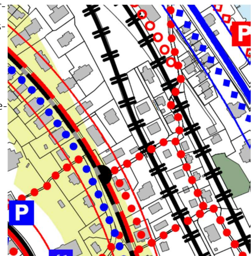
Abbildung 2 Ausschnitt kommunaler Richtplan Verkehr, Thalwil, 2015