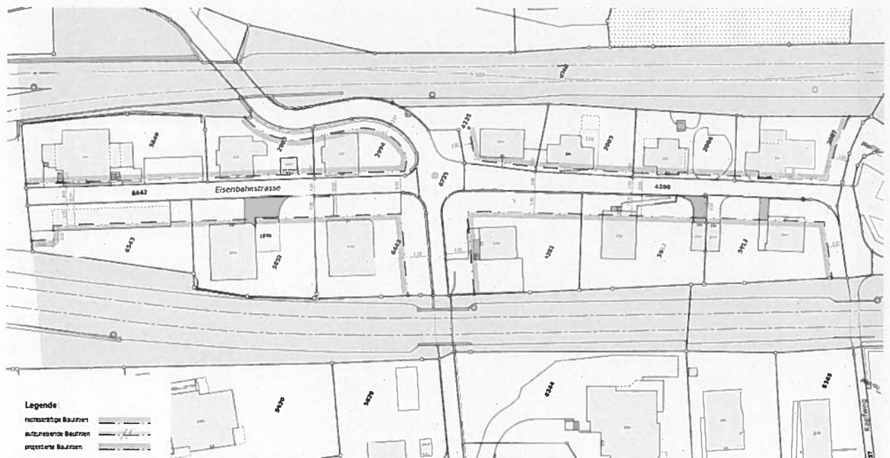
Abb.: Auszug Plan «Verkehrsbaulinien Eisenbahnstrasse», Stadt Zürich, 28.04.2021

Für alle Grundstücke wurde auf Basis der Grundordnung und unter Annahme verschiedener Strassenabstände die Überbaubarkeit überprüft. Auf dieser Basis sowie unter Berücksichtigung der Erschliessungsfunktion der Eisenbahnstrasse und der Bebaubarkeit wurde der künftige Strassenabstand für die Eisenbahnstrasse und deren Zufahrten gemäss Plan «Baulinien Eisenbahnstrasse» vom 28. April 2021 festgelegt. Am nördlichen Ende wurde zudem eine Raumsicherung für eine Wendemöglichkeit vorgenommen. Diese soll die Möglichkeit zur Erstellung eines Wendeplatzes auf der Privatstrasse im Bedarfsfall sicherstellen.