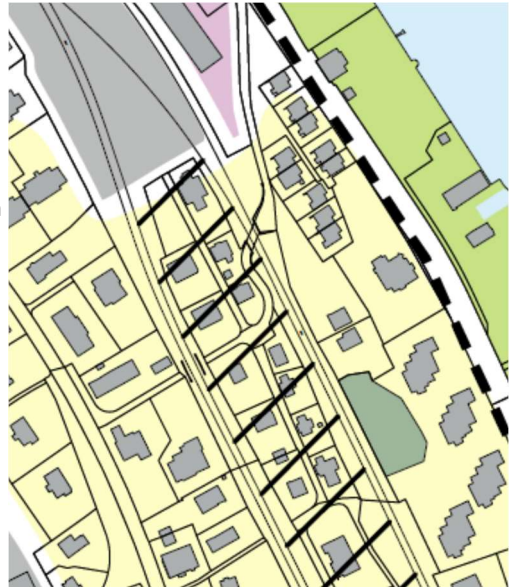
Abbildung 1 Ausschnitt kommunaler Richtplan Siedlung und Landschaft, Thalwil, 2015

Weiter ist das Quartier mit einer Schraffur Transformationsgebiete überlagert. Demnach gilt der generelle Ansatz "Weiterentwickeln" und "Umstrukturieren". In nachgeordneten Verfahren sind verschiedene Entwicklungsmöglichkeiten zu prüfen.